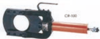
ケーブルカッター 分離油圧式