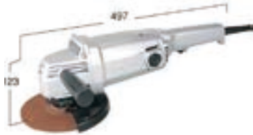
グラインダー(大) 日立 PDH180C