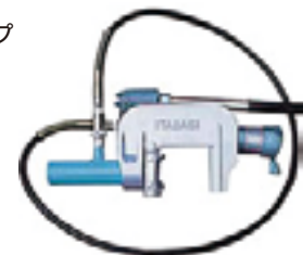
塩ビパイプ 圧着機 P50