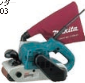
ベルトサンダー マキタ9403