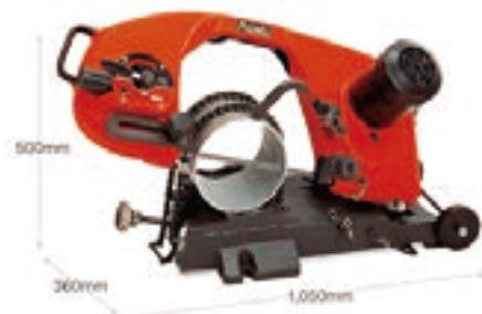
ロータリーバンドソー 100V アサダ222