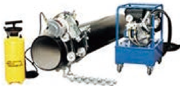
油圧式キールカッター N450