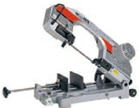
ロータリーバンドソー 100V RB18

〈能力〉 タッピングタイプ NS75~250の加工に 小型・軽量 14kg 〈セット内容〉 OP-3NS本体、100Vモーターセット、ガイドリング 1サイズ 管台 2個