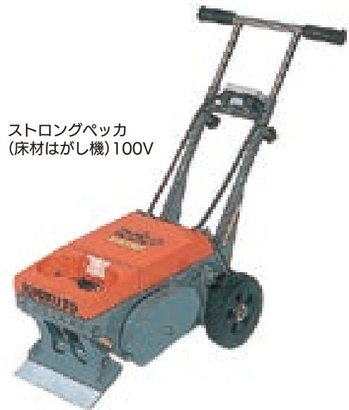
ストロングベッカ (床材はがし機)100V