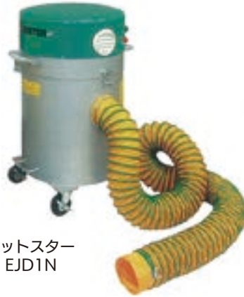
ジェットスター ミニ EJD1N