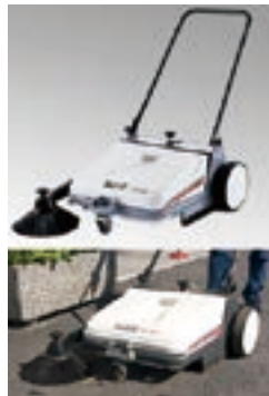
手押しスイーパー MARTEC700M