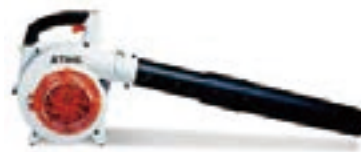
エンジンプロアー BG85