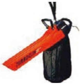
フロアー集塵機 100V ターボクリーン