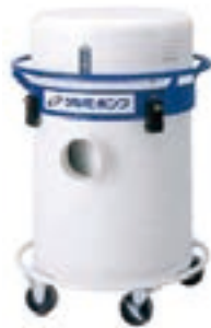
集塵機 JS2-10 100V