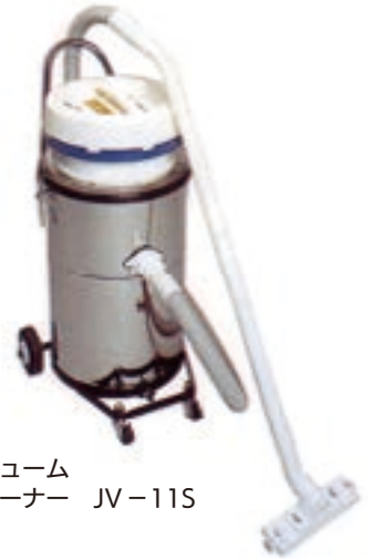
パキュム クリーナー JV-115