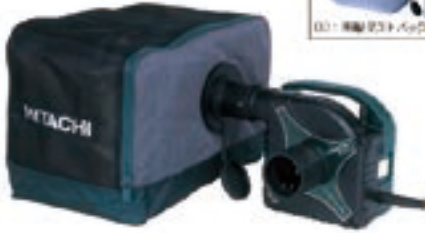
日立製 小型集塵機 R 30Y3 型

*機械のメーカー、仕様、サイズ、外観、色等は予告なく変更されている場合がございます。ご了承ください。