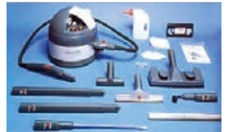
スチームクリーナー エコプロ3000

ふつうの水道水を本体ボイラーでパワフルなスチームに変える。高温スチームだから除菌効果も抜群。アレルギーの原因、花粉やダニの駆除にも威力を発揮。強力な洗剤や薬品は不要で、人と環境に優しい。油汚れ、たばこのヤニ、絨毯のシミ、ガラスの油膜などがこんな汚れもすばやくキレイに。