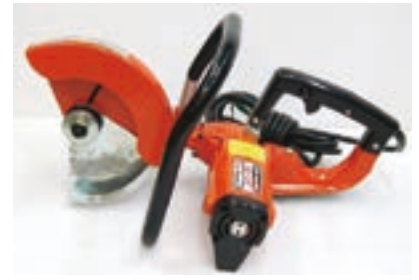
電動ハンドカッター10吋 100V 280EH 288AE