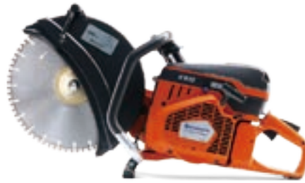
エンジンカッター 12吋 K950/K970