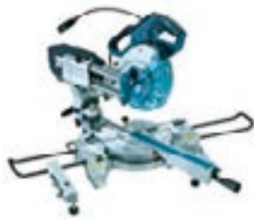
スライド丸ノコ 100V LS0713

★両傾斜!長尺な巾木等材料を 固定したまま傾斜切断可能! 最大46°まで傾斜切断可能! 左右45°さらに1°傾斜可能。