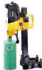
電動コアドリル 100V RC130