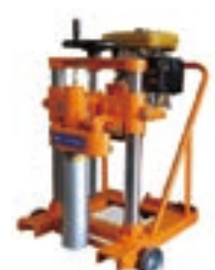
エンジン式コアカッター (コアマシン) NBS-300EH