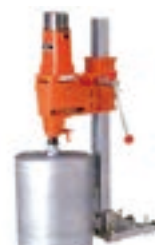
電動コアドリル 100V CD300X